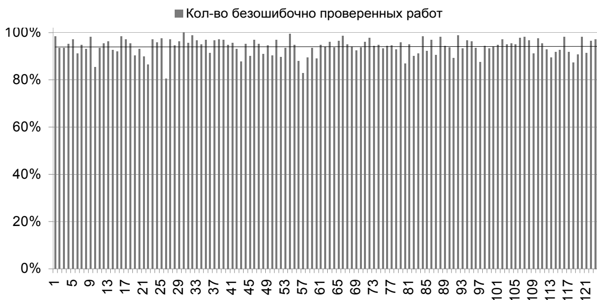
Рис. 1. Статистика работы экспертов

В 2011 году формулировки заданий КИМов существенно отличались от предлагаемых ранее и представленных в демоверсиях, что усложнило работу экспертов. Были внесены изменения и в содержание заданий: усложнение области определения в задании С1, использование специфических особенностей программной среды в задании С2, инверсная формулировка заданий («от противного») в задании С3 вызвали затруднения в работе экспертов и повлияли на увеличение процента работ, отправленных на третью проверку. Процент работ, переданных на третью проверку, составил в среднем 20,87% (в 2010 году – 16,15%, в 2009 году – 18%). Проанализированные результаты работы членов предметной комиссии представлены на рис. 1.